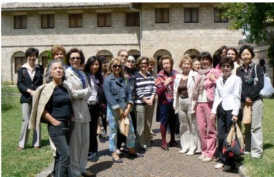
Gita a Subiaco 30 maggio 2007