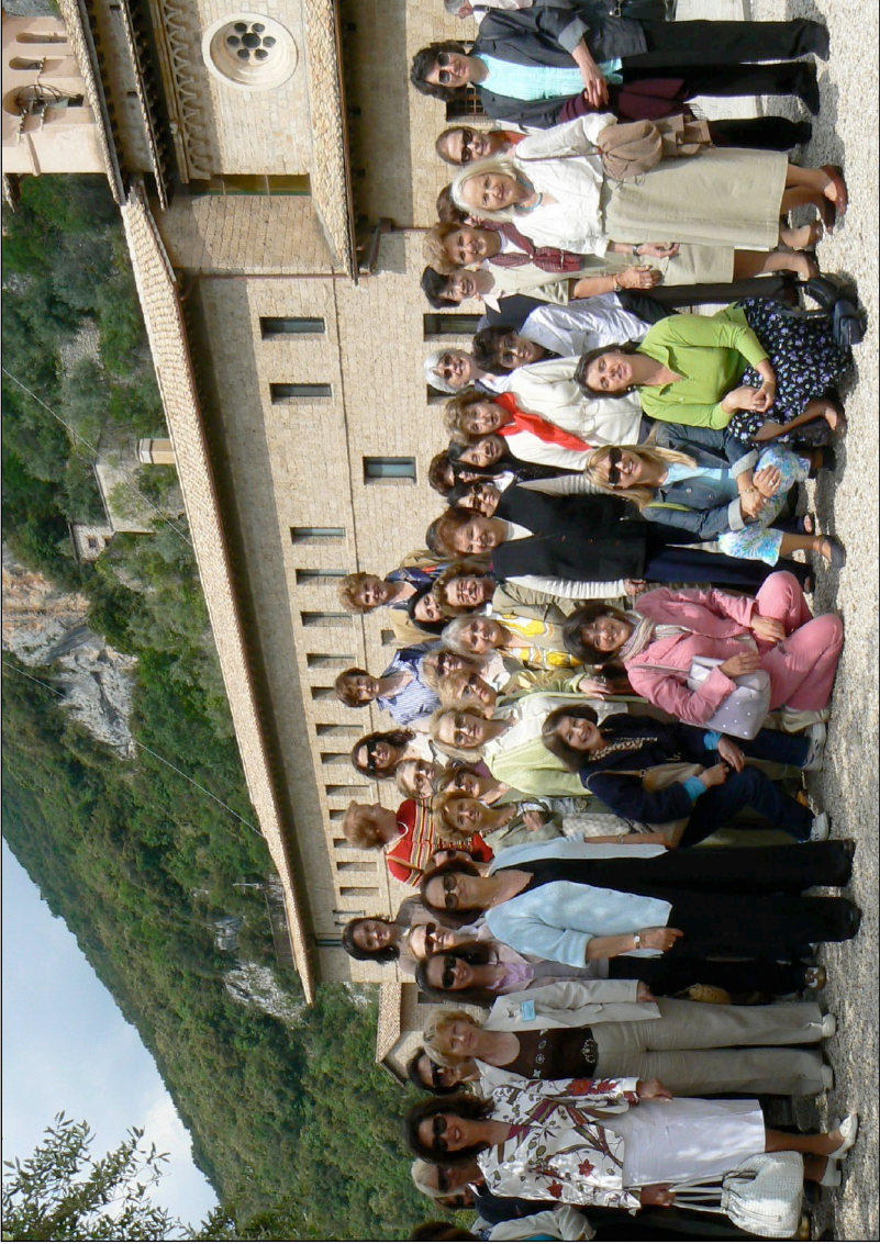
Gita a Subiaco - 30 maggio 2007