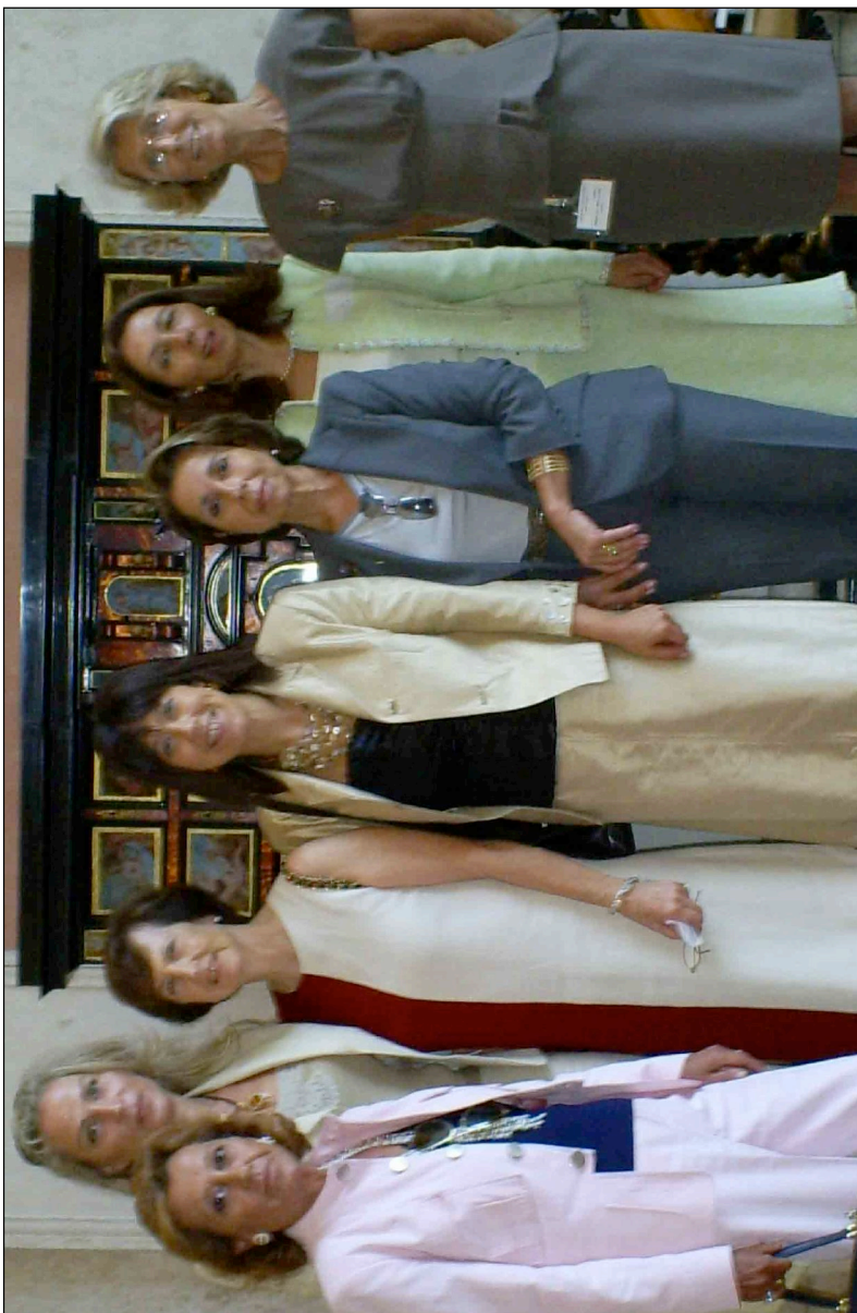
Apertura dell'anno sociale 2006-2007 dell'ACDMAE - Villa Madama