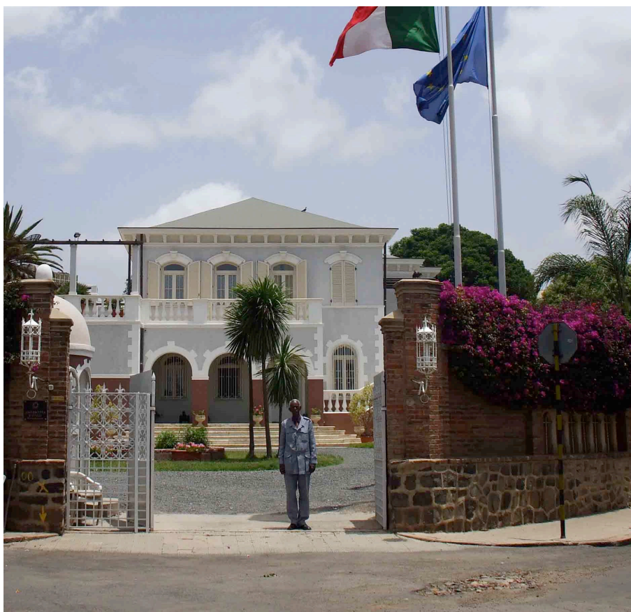
Residenza Italiana ad Asmara

Preparo i bagagli, mi dispiace andar via.