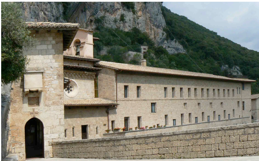
Gita a Subiaco 30 maggio 2007